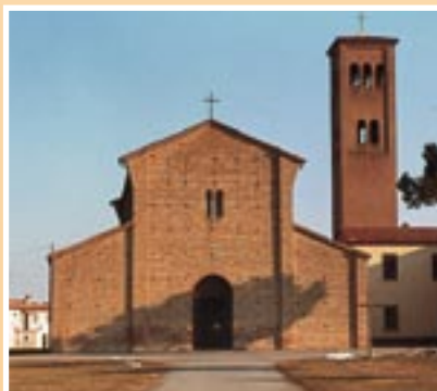
GODO - PIEVE DI S. STEFANO - SEC. XI