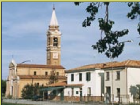
BONCELLINO - TERRA DEL PASSATORE