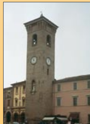
BAGNACAVALLO - Torre Civica, sec. XIV

Sono possibili iscrizioni cumulabili in un unico bollettino