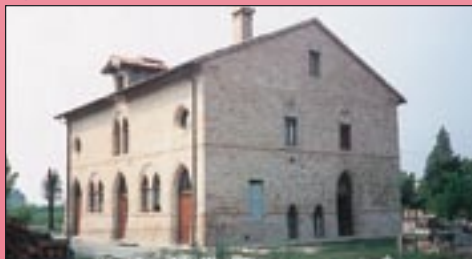
VILLA DELLE ORFANELLE - SANTERNO - SEC. XVI